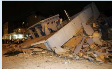
Colapso de vivienda zona centro Cumandá