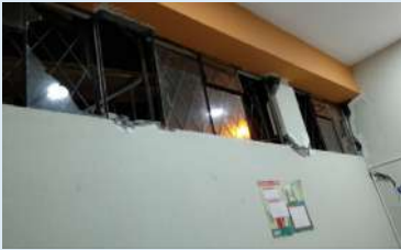
Centro de Salud Cumandá