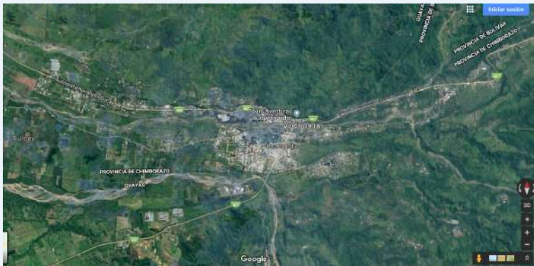
Mapa de la zona de afectación