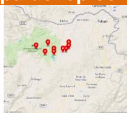
Figura 1.a. Mapa de Localización Sismos superficiales y sentidos de magnitud local 5.2 (5.6 Mw) y 4.1 y otras réplicas ocurridas en la zona de Potrerillos al sur-este del volcán Chiles y a unos 18 km de la población Tulcán.

Según el reporte especial No. 07 emitido a las 09:45 por el IGEPN, El día lunes 25 de julio de 2022 a las 08h33 TL, se registró un sismo de magnitud 5.2 MLv, cuyo epicentro se localiza en Ecuador - Carchi. (En la figura 1). Se registraron un total de 8 réplicas, la de mayor magnitud de 4.1 a las 08:38 y la de menor magnitud de 2.9 a las 9:33