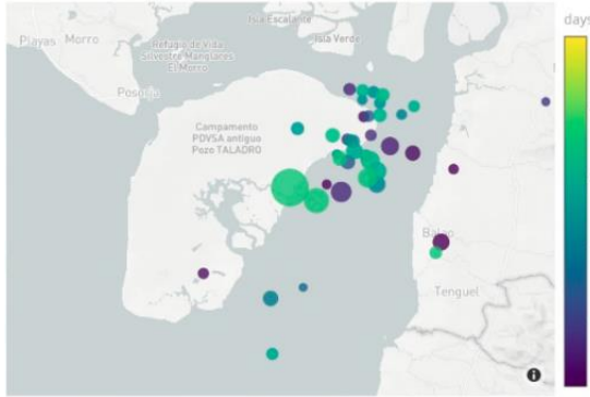
Mapa A. Localización de eventos en la zona del golfo. La escala de colores representa los días transcurridos desde el evento del 18 de marzo que tuvo una magnitud 6.64 Mw.

Luego del evento registrado a las 12h12 del 18/04/2023 (TL), en la zona del Golfo de Guayaquil, con una magnitud 6.64 Mw y profundidad de 63.1 km, se han registrado 63 réplicas con magnitudes entre 2.1 y 4.6 MLv.