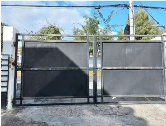
Anexo 1.- Puerta de ingreso a la CZ9.