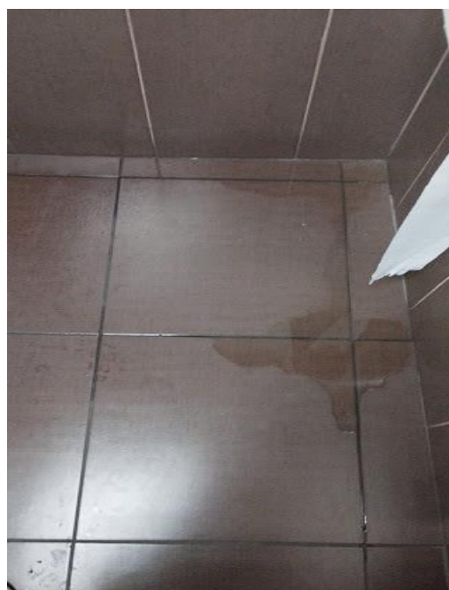
Anexo 5. Filtración de agua. Área de Análisis de Riesgos