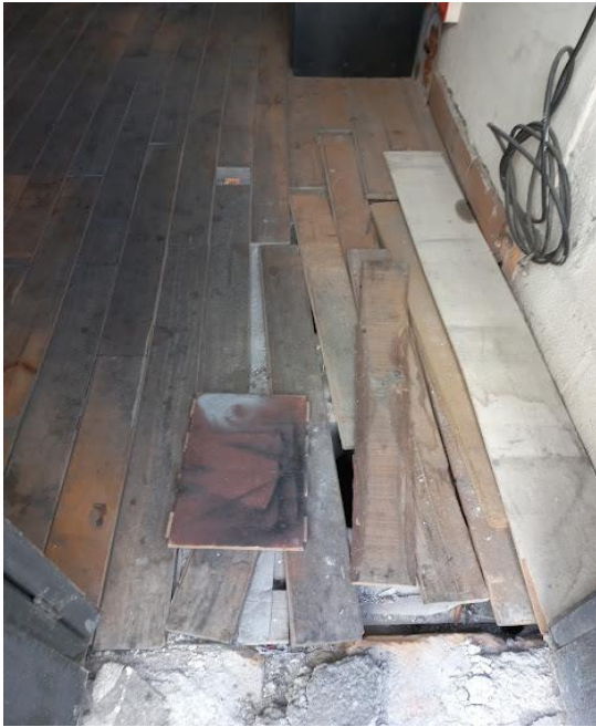
Anexo 3. Piso área de guardianía