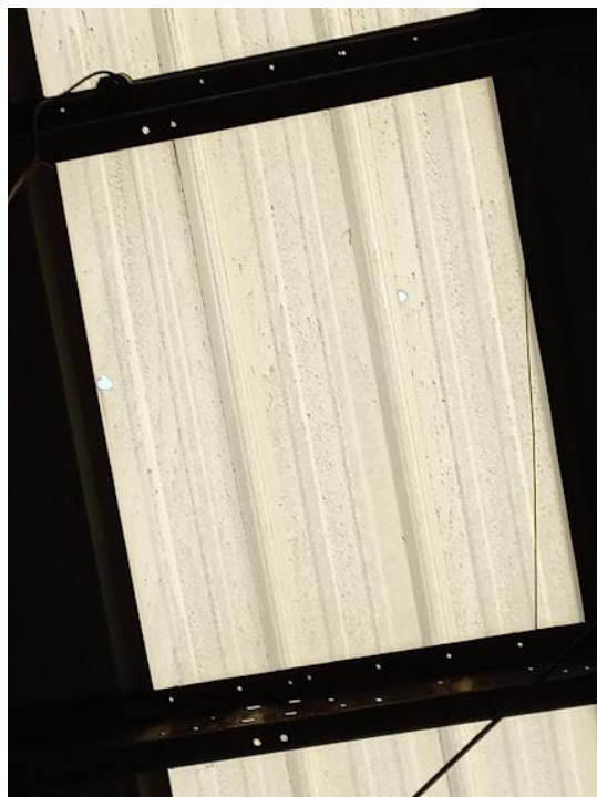
Anexo 2. Hojas Traslucidas. Área de bodega.