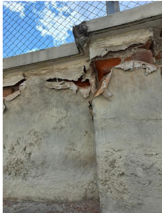
Anexo 4. Cerramiento Interno CZ9