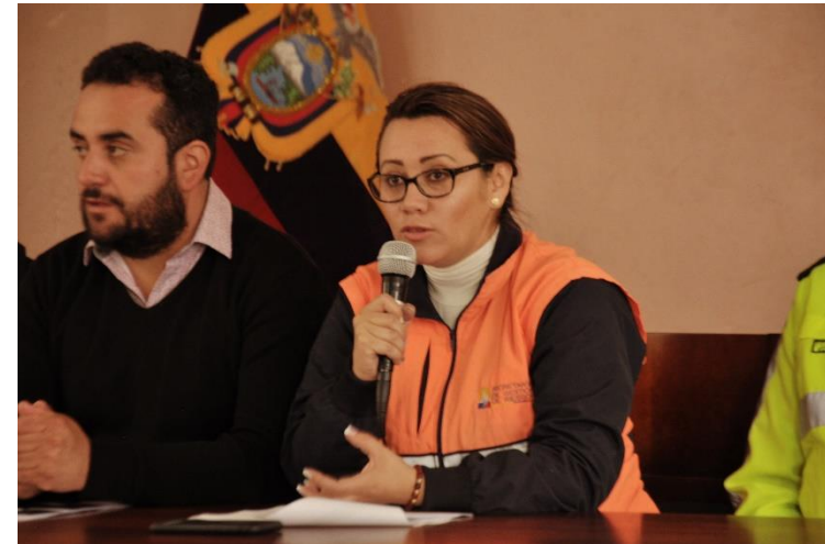
Presentación del Plan de Contingencia de Chimborazo para la temporada de incendios forestales.