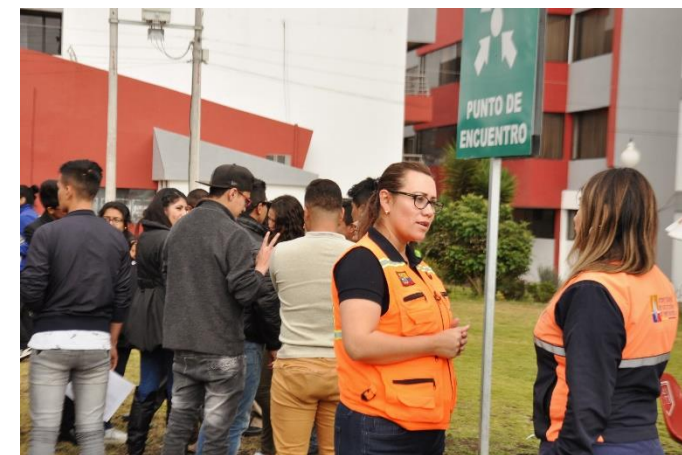
Simulacro desarrollado con la Universidad Técnica de Ambato, en el que participaron diez mil personas.