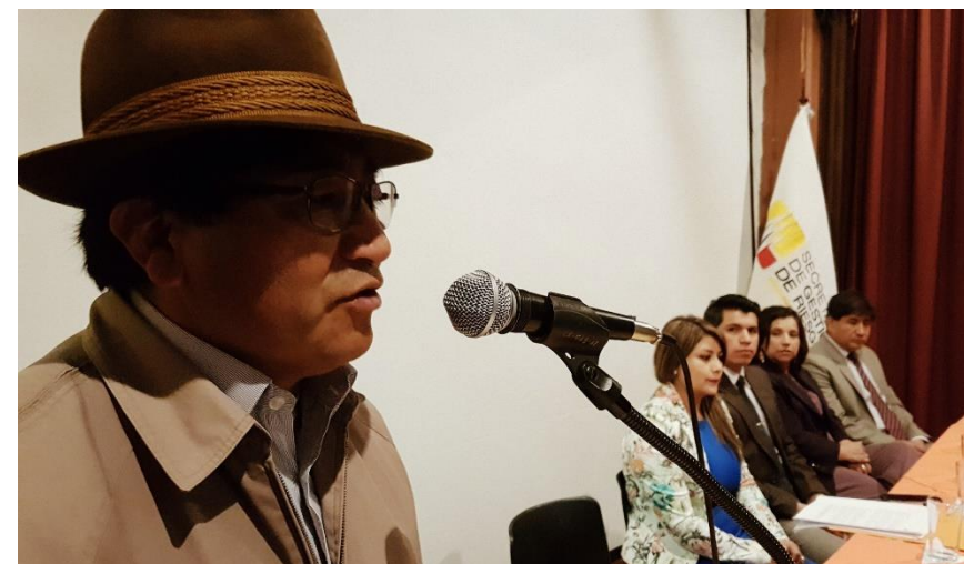
Evento de reconocimiento de la Red de Participación Ciudadana de Gestión de Riesgos del cantón Riobamba.