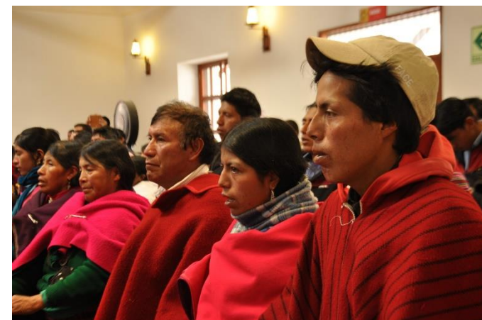
En el cantón Guamote de han conformado varios Comités de Gestión de Riesgos.