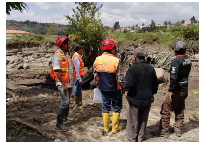
Inspección técnica realizada en el cantón Guano, en noviembre, por la ocurrencia de un aluvión que afectó a varias familias.