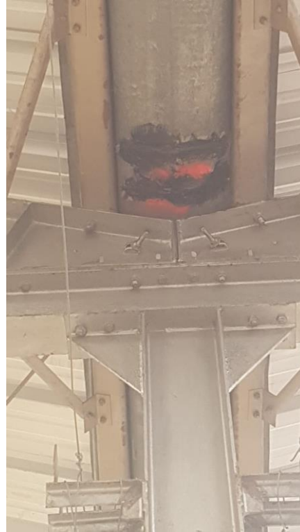
CUBIERTA BODEGA CZ9