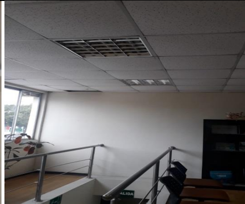
REVISIÓN LÁMPARAS EDIFICIO CZ9