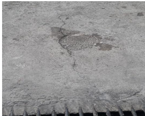
REPAVIMENTACIÓN ZONA DE CARGA – BODEGA CZ9