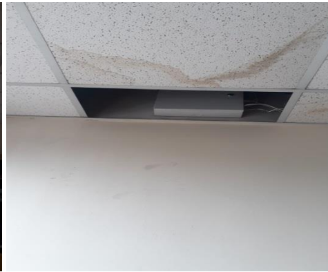
REVISIÓN CIELO FALSO EDIFICIO CZ9 Y EDIFICIO MONTESRRIN