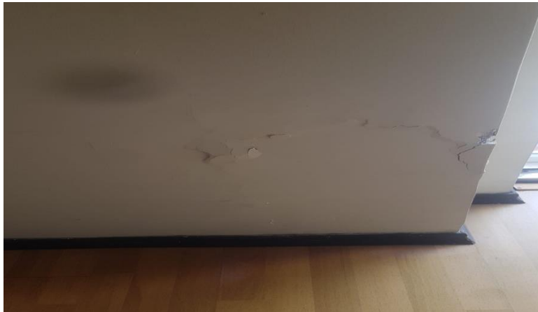
REVISIÓN HUMEDAD EDIFICIO CZ9 Y EDIFICIO MONTESERRIN