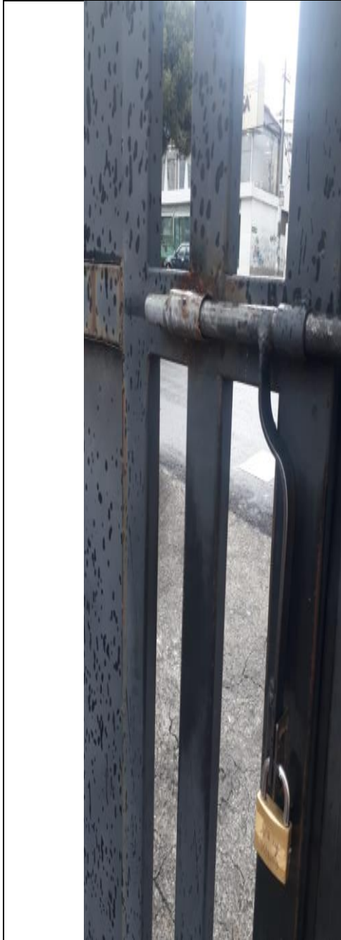
PUERTA PRINCIPAL PARA INGRESO AL PARQUEADERO DEL EDIFICIO CZ9