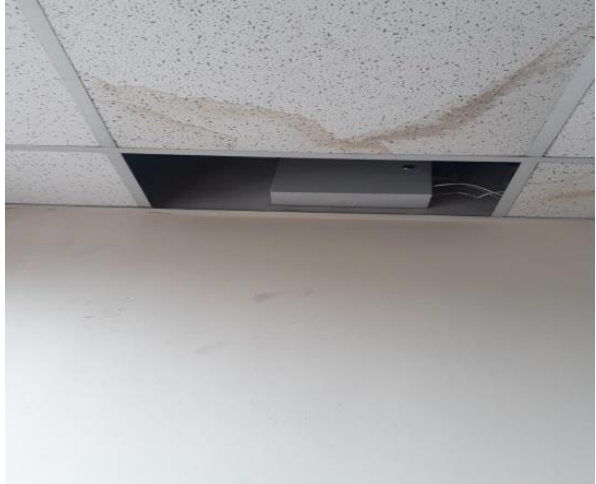
CUBIERTA EDIFICIO CZ9