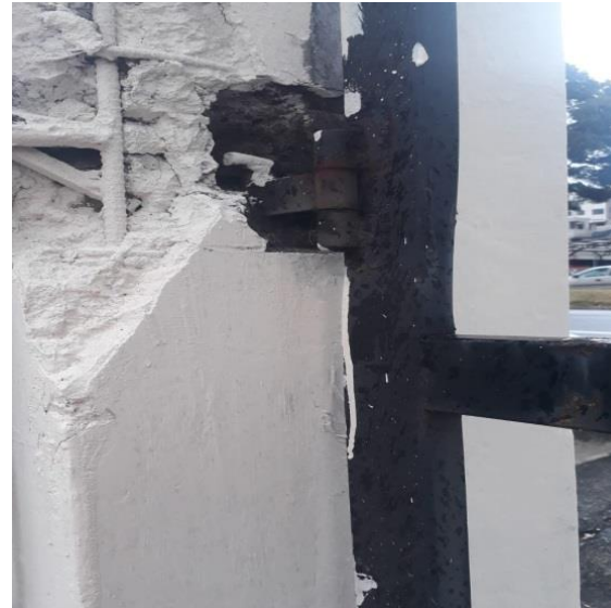
PUERTA SECUNDARIA PARA INGRESO AL PARQUEADERO DEL EDIFICIO CZ9