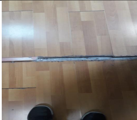
BARREDERAS Y PISO FLOTANTE OFICINAS CZ9