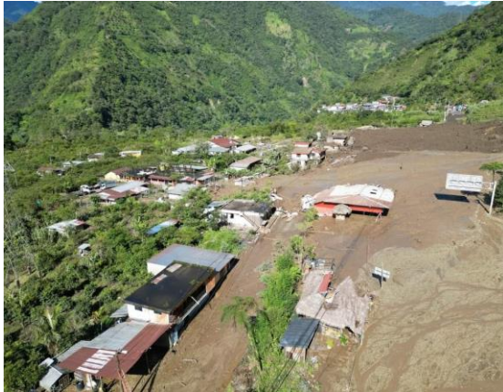
Imagen 1: Aluvión, parroquia Río Verde

SitRep generado por la Dirección de Monitoreo de Eventos Adversos de la Secretaría Nacional de Gestión de Riesgos.