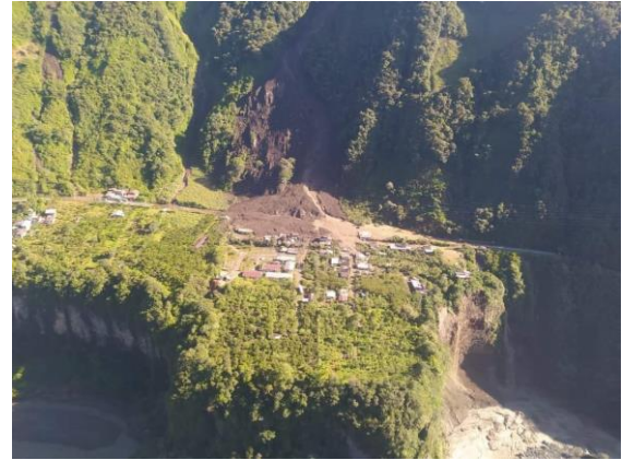
Imagen 2: Aluvión, parroquia Río Verde

SitRep generado por la Dirección de Monitoreo de Eventos Adversos de la Secretaría Nacional de Gestión de Riesgos.