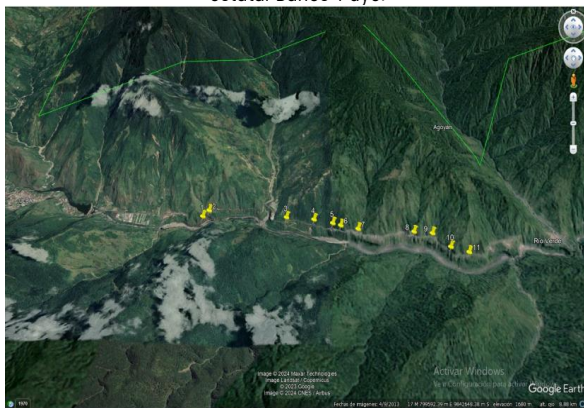
Ubicación de movimientos en masa en la zona afectada de la red vial estatal Baños-Puyo.