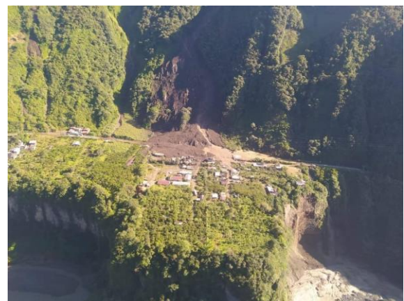
Imagen 2: Aluvión, parroquia Río Vere

SitRep generado por la Dirección de Monitoreo de Eventos Adversos de la Secretaría Nacional de Gestión de Riesgos.