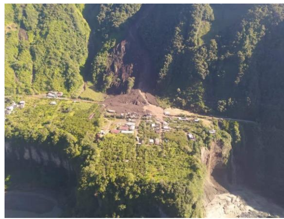
Imagen 2: Aluvión, parroquia Río Verde

SitRep generado por la Dirección de Monitoreo de Eventos Adversos de la Secretaría Nacional de Gestión de Riesgos.