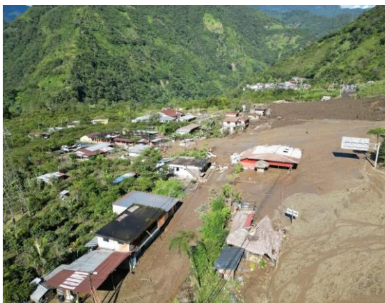
Imagen 1: Aluvión, parroquia Río Verde

SitRep generado por la Dirección de Monitoreo de Eventos Adversos de la Secretaría Nacional de Gestión de Riesgos.